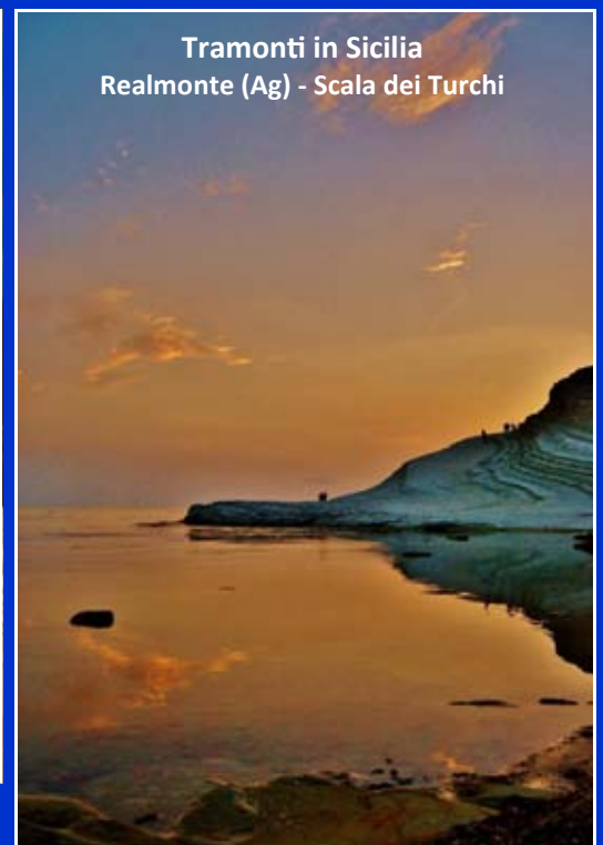
Tramonti in Sicilia Realmondo (Ag) - Scala dei Turchi