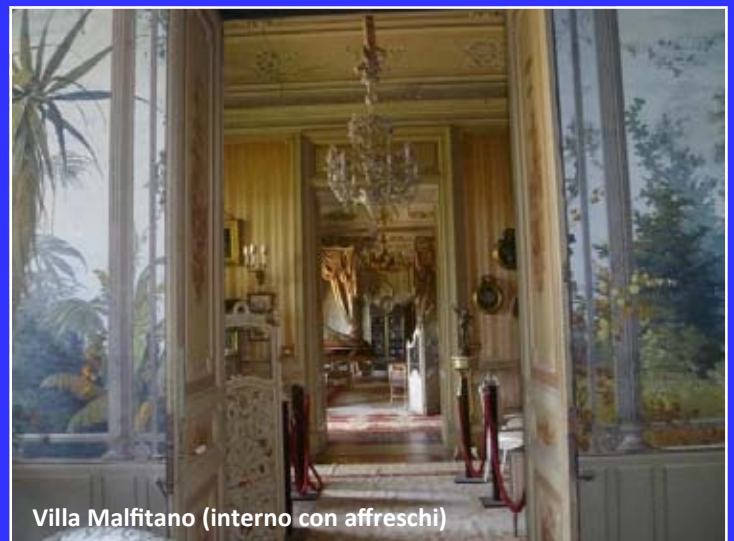
Villa Malfitano (interno con affreschi)

Continuare il pellegrinaggio e raggiungere così la Zisa. Lasciar affiorare nella mente l'immagine degli antichi aranceti che un tempo attorniavano la residenza regale costruita in stile fatimide. Esplorando gli splendidi spazi interni pare allora di sentire ancora il profumo di zagare e la frescura che li pervadeva quando fuori lo scirocco padroneggiava la città.