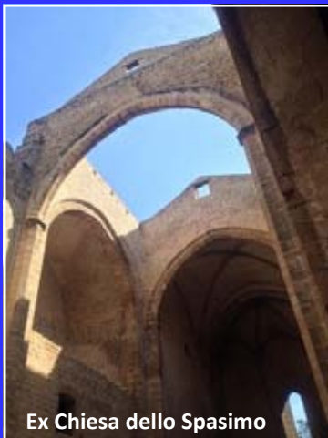
Ex Chiesa dello Spasimo

Lunedì, alzarsi di buonora per seguire il rito greco albanese di una funzione in una chiesa di epoca normanna con l'inconfondibile cupola rossa, vicino a piazza Pretoria detta anche della Vergogna, per quell'innocente oscenità delle statue rinascimentali che adornano la fontana. E avventurarsi nei tracciati antichi delle vie dei quattro Mandamenti in lunghe peregrinazioni, entrare nel parco e nella villa Malfitano col suo fascino tardo Ottocentesco intatto, proseguire fino alle catacombe dei Cappuccini che svelano ai vivi il segreto della morte, la rendono anch'essa commedia umana e accettabile, vicina.