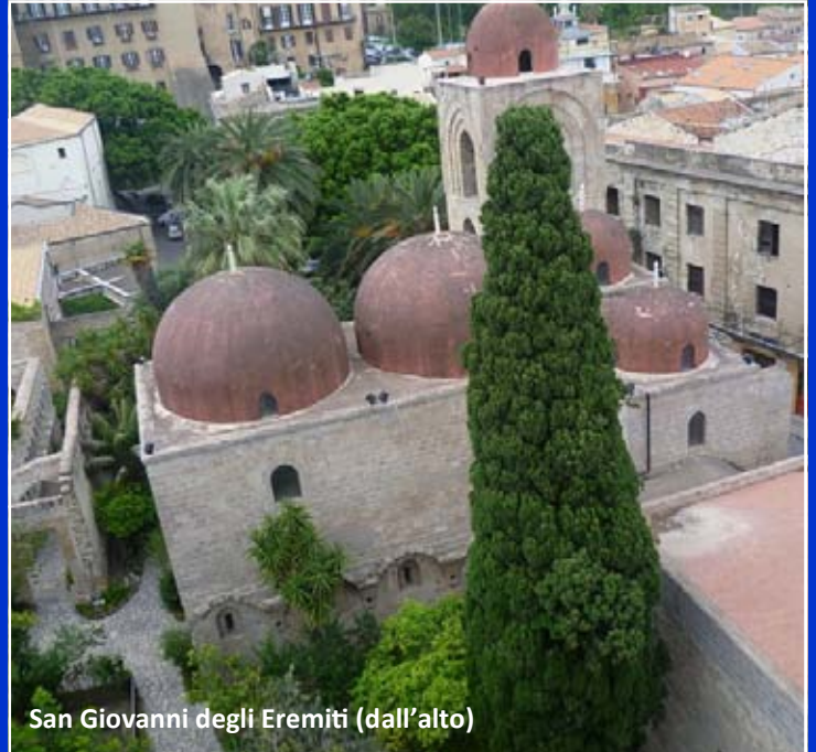
San Giovanni degli Eremiti (dall'alto)

Assistere alle prove di un laboratorio di teatro gestito dallo Stabile di Palermo al Nuovo Montevergini, altra chiesa sconosciuta, di cui si intravede la ricchezza, dietro le strutture metalliche del palco e di una platea provvisoria, teatro nel teatro vien da pensare.