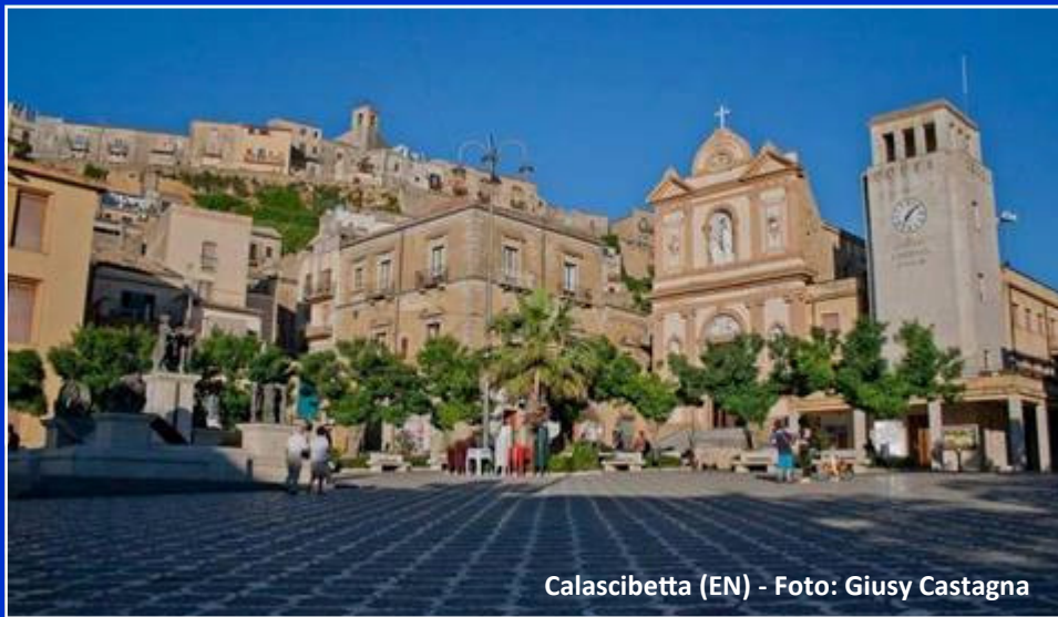
Calascibetta (EN)