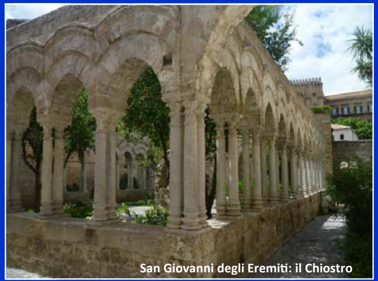
San Giovanni degli Eremiti: il Chiostro

C'è ancora tempo in questo giorno per raccogliersi nel chiostro di San Giovanni degli Eremiti, con le sue esili eleganti colonne, salire sul campanile della chiesa lì a fianco per vedere il complesso di epoca normanna, ancora una volta con le sue cupole rosse di compassionevole bellezza, anche dall'alto. Immergersi poi in questo pomeriggio ventoso nella vita contemporanea del vicino Ballarò ed entrare un attimo nella chiesa del Gesù coi suoi marmi policromi, segno insuperabile di una ricchezza che dispregia la morte.