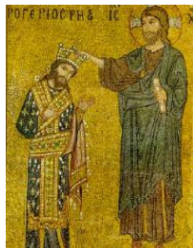
Il mosaico della chiesa della Martorana in Palermo ove Ruggero II appare incoronato da Cristo.

ripetutamente, mi piace richiamare un passo che reputo quanto di più azzeccato e illuminante, da un suo pamphlet su Federico III, quel "re da leggenda", come ebbe a definirlo, nel 1951, lo storico spagnolo Rafael Olivar Bertrand, che il professore riportò alla luce della memoria e di cui ritrovò la stessa tomba, dimenticata anch'essa in una cripta della Cattedrale di Sant'Agata, a Catania: «Quando si vuole ridurre un popolo allo stato coloniale gli si toglie la cultura, la lingua e la storia, in maniera che i "colonizzati" finiscano con l'identificarsi con la cultura, la lingua e la storia del paese dominante. E così i Siciliani si sono convinti del fatto che non hanno una loro cultura, che la loro lingua è un rozzo dialetto (nel secolo XIV e