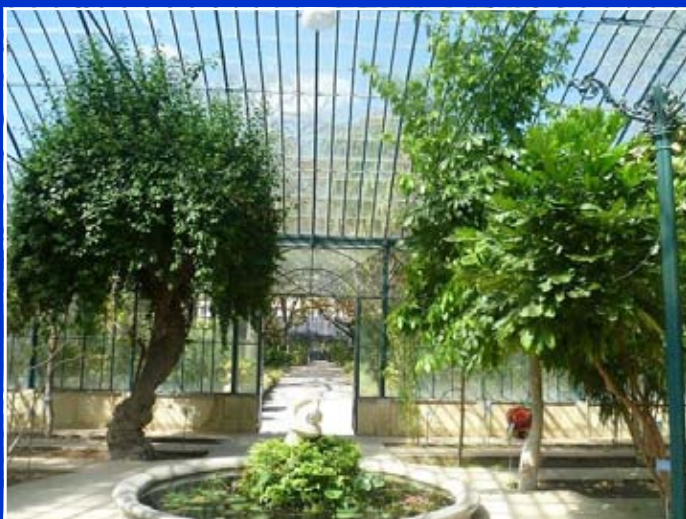
Orto Botanico ( Serre)