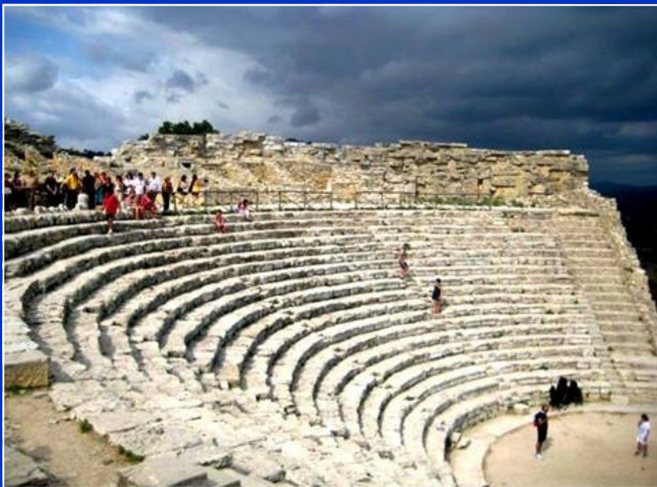
Teatro greco di Segesta

CALASCIBETTA (EN) - IL NOME Dall'arabo Qalat-sciabat (il castello sulla vetta): è infatti posta sull'altura che fronteggia Enna, a 691 metri sul mare. GLI ABITANTI Calascibettesi