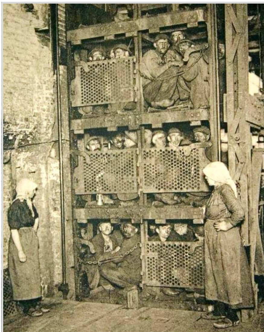
Questa foto ricordo serve per non dimenticare come hanno trattato noi italiani, ora chi entra nel nostro paese sembra che abbia più diritti di tutti noi.

Italiani emigrati per vera fame e non per esportare culture, non pretendevano né case né sussidi né avevano la sanità gratis, non avevano nessun politico a difenderli!