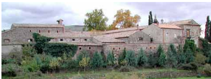
Una visione d'insieme dal torrente Saraceno del complesso denominato Ducea (o Castello) Nelson con l'Abbazia benedettina, la Chiesa di Santa Maria di Maniace ed un grande lussureggiante parco.

Il 3 settembre del 1799, fu donata da Ferdinando IV di Borbone all'ammiraglio inglese Horatio Nelson, nominato Duca di Bronte, quale ricompensa per l'aiuto fornito durante la rivoluzione giacobina che, il 23 gennaio di quell'anno, aveva portato alla proclamazione dell'effimera Repubblica Napoletana. Da allora, l'intera tenuta divenne la Ducea di Nelson , l'abbazia il Castello di Nelson .