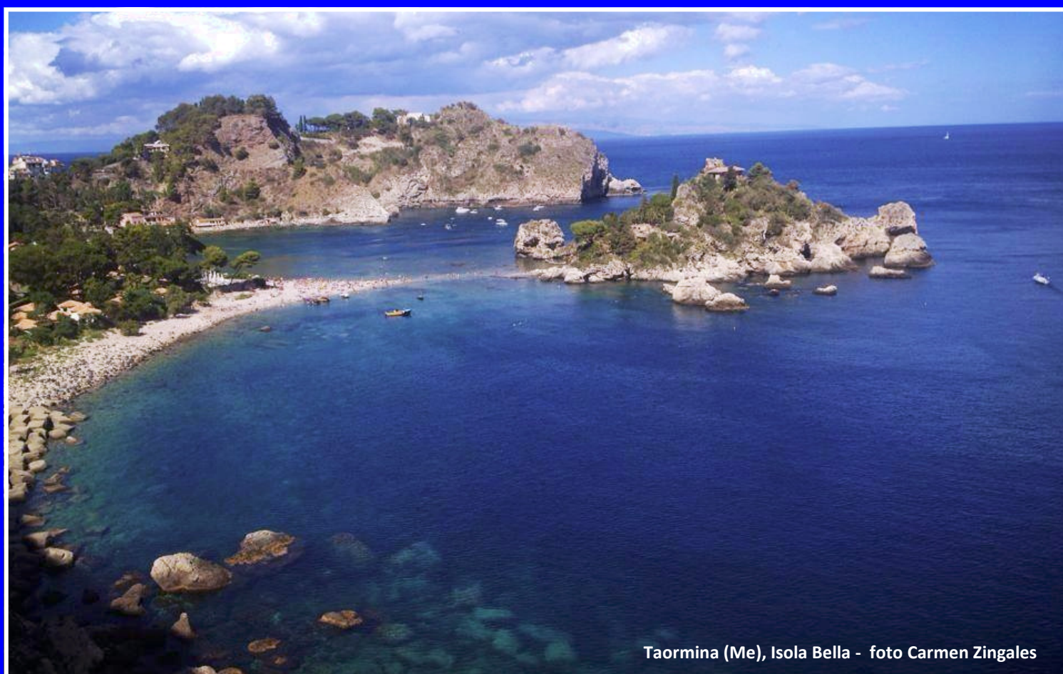
Taormina (Me), Isola Bella

Bimestrale (sauf Juillet - Août) di cultura, politica, informazione della diaspora siciliana - Anno XVI - n° 4 - Settembre/Octobre 2014 Ed. Resp.: Catania Francesco Paolo, Bld de Dixmude , 40 bte 5 B - 1000 Bruxelles - Tél & Fax: +32 2 2174831 - Gsm: +32 475 810756