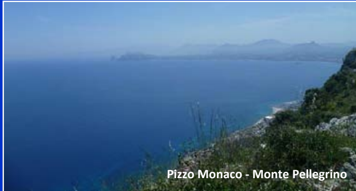
Pizzo Monaco - Monte Pellegrino

Quest'altro giorno salire a piedi al santuario della patrona, la santuzza, sul monte Pellegrino che domina la città. Percorrere l'"acchianata", un'antica via lastricata che sale dolcemente tra i fichi d'india e la rigogliosa vegetazione mediterranea e ammirare con una mezza preghiera sulle labbra la statua della santa rivestita d'oro, nella grotta del santuario dove il gocciolio perpetuo dell'acqua dà sollievo dopo la fatica della salita. Fuori nel sole raggiungere la punta del promontorio su un sentiero che attraversa il bosco rado e immergersi nel blu del cielo e del mare che paiono toccarsi, e quasi si confondono, all'orizzonte, e perdersi con gli occhi nel panorama del golfo di Palermo che di quassù puoi vedere per intero.