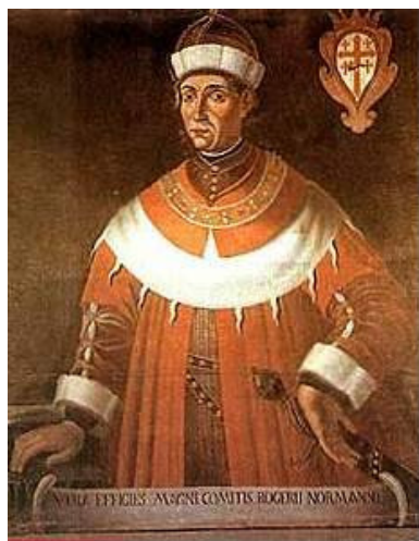
Ruggero I di Sicilia

U no dei quesiti più frequenti è quello relativo all'individuazione del più antico documento in carta esistente in Europa. La risposta arriva dall'Archivio di Stato di Palermo: la "prima vera carta" risalirebbe addirittura al marzo del 1109 ed è detta il Mandato di Adelaïsa. Terza moglie di Ruggero I conte di Sicilia e di Calabria (1031 - 1101), fondatore della dinastia dei Normanni nell'isola.